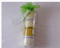
Krenstängla 4 x 50g 3.60EUR